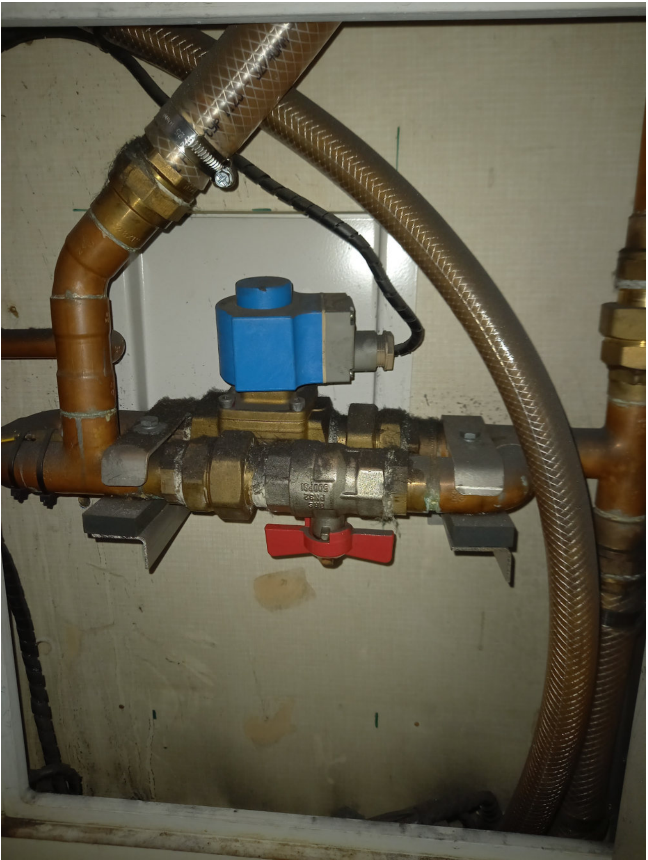
Odvodňovací kohout otevřen. Voda z nádrže vytéká pod vůz. Nad ním patrný el.ventil automatického odvodnění nádrže.