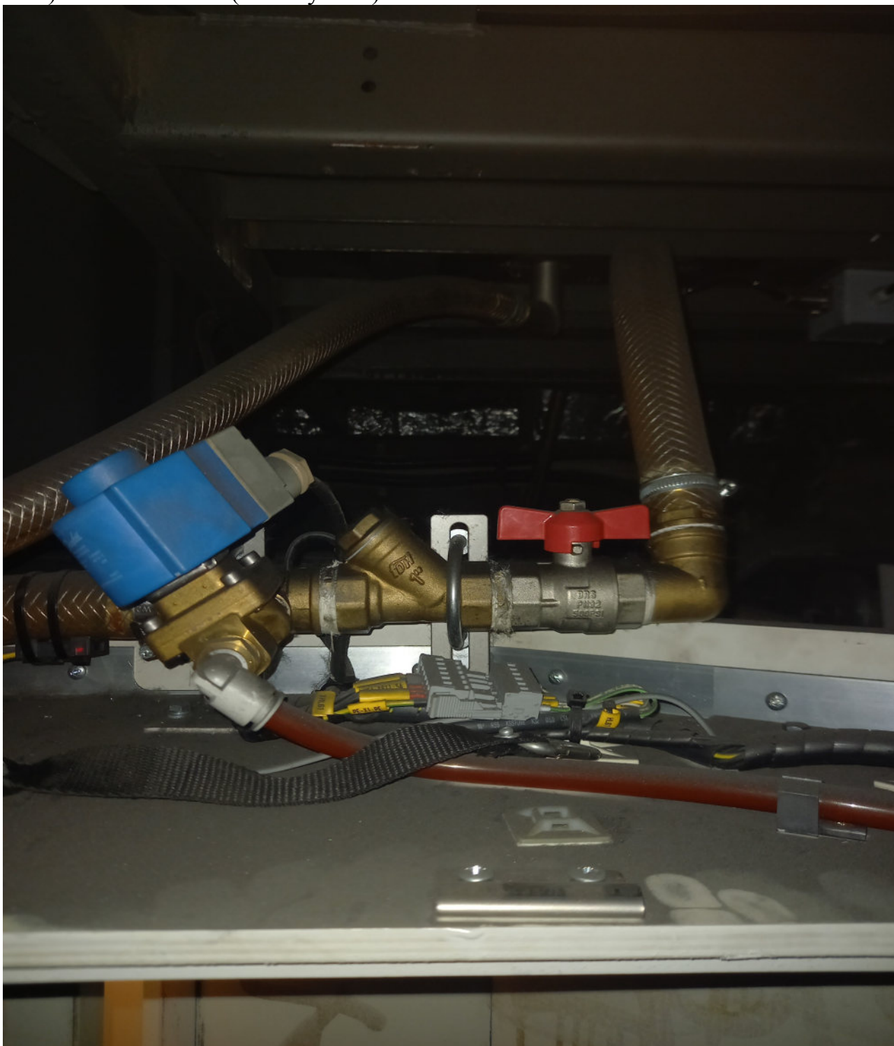
c) Kohout nádrže (studený start).

Pokud by patro bylo vymrzlé, je před plněním vodou žádoucí uzavřít kohout nádrže nacházející se ve stropu, jinak voda vyteče přes vypouštěcí el.ventil mrazové ochrany. Po zvýšení teploty ve vozidle se mrazová ochrana deaktivuje a el. ventil nouzového vypouštění vody se uzavře. Po otevření kohoutu nádrže by pak voda již neměla vytékat z vozu.